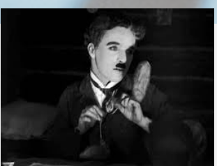
« Les petits pains » extrait de La Ruée vers l'or – Charlie Chaplin