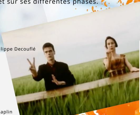
Le P'tit bal – Philippe Decouflé