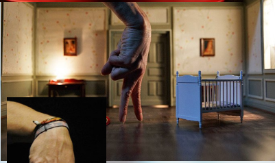
Agwa – Mourad Merzouki