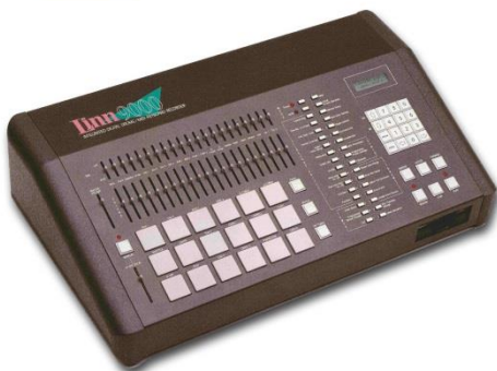
Boîte à rythmes (linn9000)