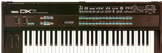
Synthétiseur (Yamaha DX7)

A cette époque, Miles Davis est très intéressé par les nouveaux sons proposés par les synthétiseurs.